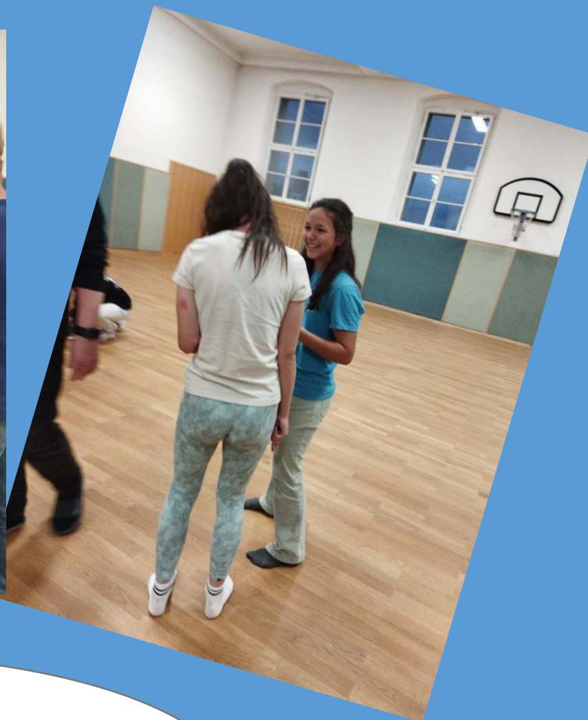
Az is jó volt a zárándoklat során, hogy sok új barátot szereztem.